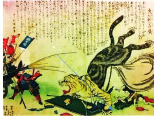
コレラ退治の図（明治時代初期）