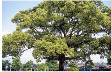
市の木 くすのき Official city tree: Camphor tree

昭和32年、町制10周年を記念し、旭町議会で制定され、市制施行後も引き続き、市章としています。旭の字が3つ丸く連なり、市民の団結と発展を示しています。