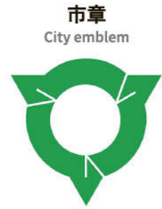
市章 City emblem

昭和32年、町制10周年を記念し、旭町議会で制定され、市制施行後も引き続き、市章としています。旭の字が3つ丸く連なり、市民の団結と発展を示しています。