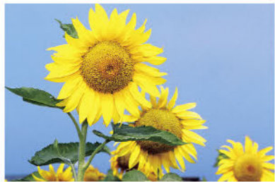
市の花 ひまわり Official city flower: Sunflower