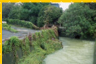
平成12年9月11日 東海豪雨で増水する市内の川の様子