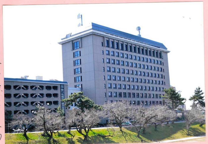
西三河総合庁舎(八階)会場