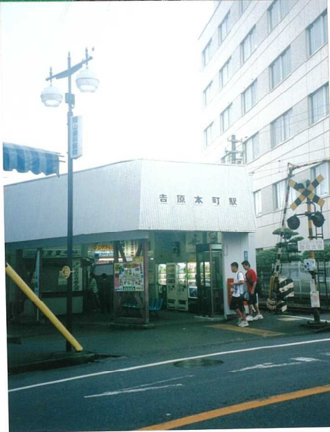
現在のJR吉原駅付近は初期の吉原街(吉原下)である。

鶴生の碑、かすりのあたりは白酒が名物の本市場といふ立場だった。ここから見ると富士の中腹に雲を巻くさまなど、鶴が舞うさまようは自來たことに由来する碑。