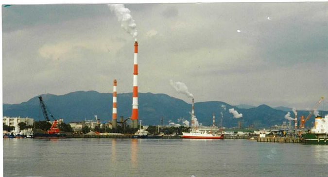
岡子・蒲港、夜念富士作鹿北の。

発行所：地域環境活性化協議会 編集者：代表幹事 高橋 賢一 連絡先：市民活動支援センター 尾張旭市渋川町三丁目5番地7 (渋川福祉センター内) TEL 0561-51-2878