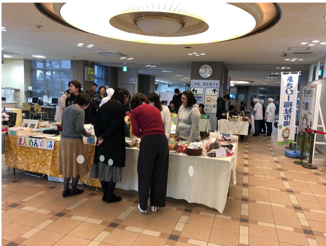
あさびー福祉市場の様子