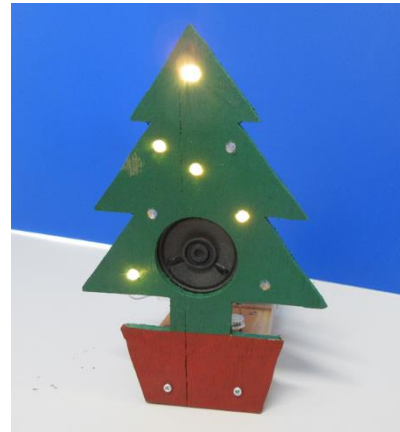
↓ クリスマスツリー