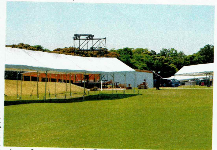
御野立所 ▲ 愛知県関係出席者テント、 ▼ 出席者の公園入口の植樹場所。

環境的親和性 (炭素削減機能易発 達性など)を生かして 家庭、地域社会を木 質化していくことにより 人間の回復として 林業の活性化を目 指す公益性をもった 活動である。 木のおもちゃや木材を 使ったものづくり活動 が子ども育成に大 きく関わり、意味の あるものであるとすれば 木育は環境での 学び(学びを又々自 身)と長期的な視点 で見れば木育活動 として重要である。