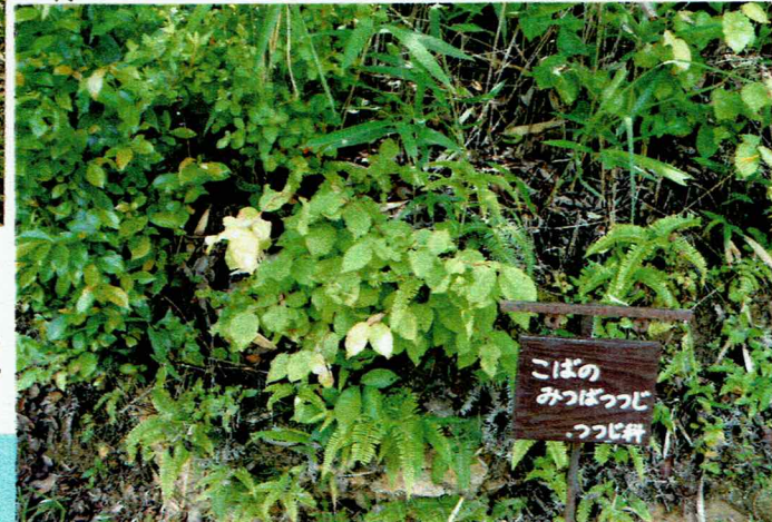
植樹 春子前 柳がわいている。コバノミツバツジ。

やワークショップ等 の短期的・個性 の取得を含めて さまざまなカン ネルを利用した 学習の機会を 増加させていく 必要がある。 教育活動の一方 で木育に期待 されてくるのは、 木材利用推進 についての具体 的成果である。 経済活動である。 木材利用は木 材の持つ生理的 親和性(ぬくもりに 似ている)による。