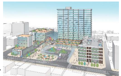
※まちづくり協議会作成計画(案)