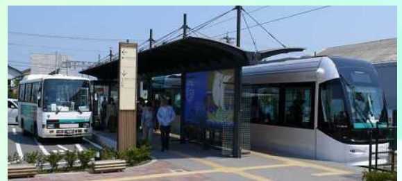
公共交通機関の利用推進