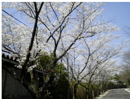
対象地の南北道路の様子

対象地の南北道路には桜並木があります。お花見ができるよう 4 月 1 日(水)～10 日(金)の間(土日以外)、一般開放しました。