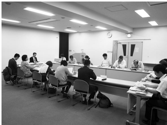
第3回懇談会の様子

構成員からは「市民の関心があまりにも低い」「市民の認知度が低い中で、個別の用途を決めていくのは無理がある」「将来において市の財政が厳しいので、今あるものを活かす」「せっかくの景観を活かした形で考えていったらいい」等の感想が出されました。