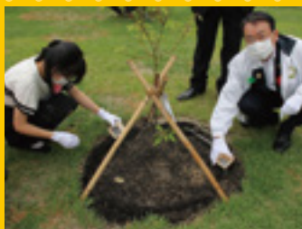
▲天皇陛下のお手植え木「クスノキ」に施肥