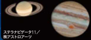
ステラナビゲータ11 / 傑アストロアーツ