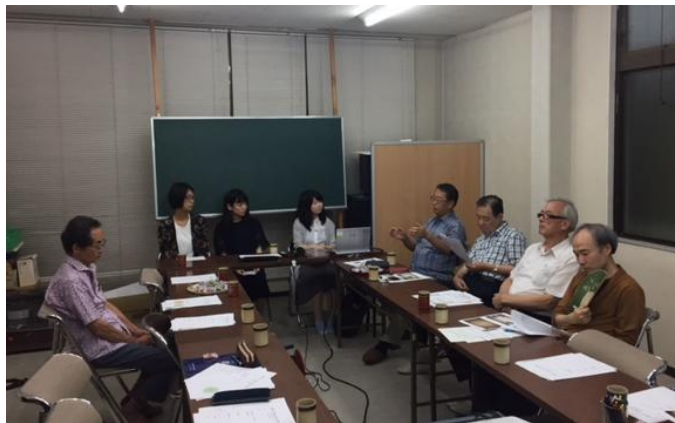
■役員会での意見交換

今後も引き続き、学生さんの調査・研究が行われますので、ご理解とご協力の程よろしくお願いいたします。