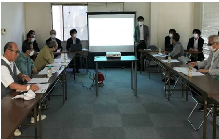
6月8日に行われた「RIA・オオバ共同体」によるプレゼンテーションの様子