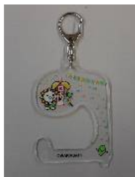
▲非接触キーホルダー