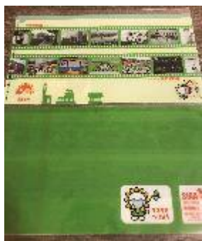
▲マスクケースと子供用マスク（2種類）