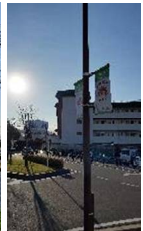
▲駅前や市役所での街灯フラッグの掲出