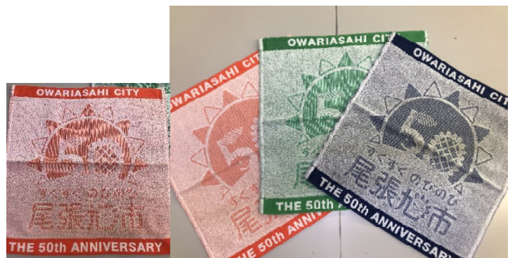
▲市民お祝い事業啓発用タオル（3色）