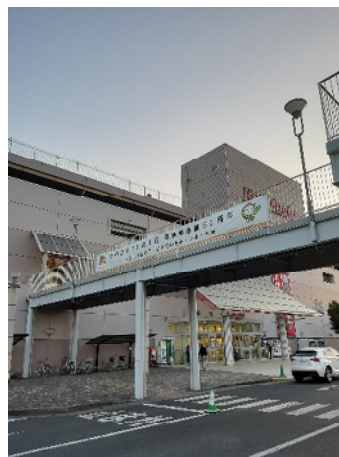
▲イトーヨーカドー尾張旭店での横断幕の掲出