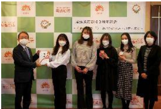
▲市制50周年記念バックパネル

市制50周年を盛り上げるため、記念グッズをはじめ、旭野高校や企業が作成した記念ポスターの掲示、市内各所での記念フラッグや卓上のぼりの掲出など、様々な啓発を行いました。