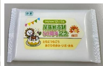
▲ウェットティッシュ