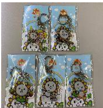
▲アクリルキーホルダー