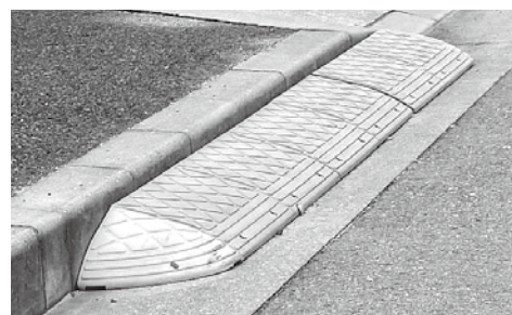
段差解消プレート

内 歩道と車道との段差を解消する目的で道路脇に段差解消プレートを設置したり、民地内から砂利などが道路に流出したりしているとオートバイや自転車の通行の妨げになり危険なほか、雨水などの排水を阻害する原因にもなります。通行の妨げになるものは除去し、自動車の乗り入れをする場合は、基準に適合した乗り入れ口を設置してください。