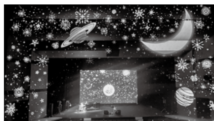
4月30日「音と光り絵コンサート」