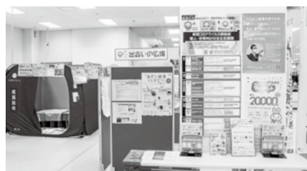
イトーヨーカドー尾張旭店 展示の様子