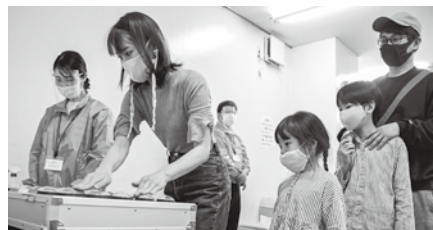
スカイワードあさひ会場の様子