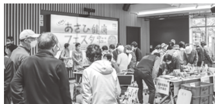
グリーンシティビルの様子