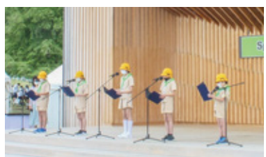
植樹祭のテーマを伝える緑の少年団

森林公園植物園は、東海地方固有の湿地を中心とした動植物が生育しており、「全国森林浴100選の森」に選ばれた緑が美しい植物園です。一年を通してさまざまな表情を見せる木々や花に心が洗われる気持ちになります。皆さんも、季節の移ろいを楽しんでみてはいかがでしょうか。