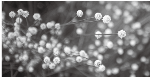
シラタマホシクサ

時 ●9月10日(土)、11日(日)午前9時～正午 ●9月15日(木)午後2時～5時(いずれも雨天中止) 場 吉賀池湿地(旭ヶ丘運動広場内に臨時駐車場あり) 内 シラタマホシクサや午後のみ花を咲かせるミズオトギリなど、秋の湿地植物の公開 費 無料 他 ●申し込み不要。動きやすい服装・靴で会場へ直接お越しください●公開日の会場案内・受け付けなどのボランティアを随時募集しています。興味のあるかたは問い合わせください