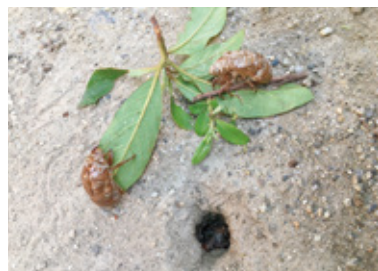
庭にできたセミの幼虫が 抜け出た穴とセミの抜け殻