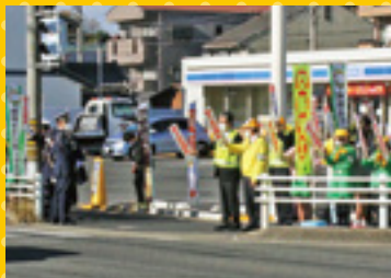
交通少年団と交通安全を呼び掛け