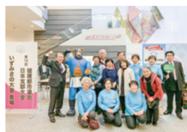
大会に参加した皆さんと

さて、「尾張旭元気モリモリ」は今回で最終回になります。この4年間は、全国植樹祭、市制50周年、新型コロナウイルス感染症の拡大など、大きな出来事の連続でした。このような中、市長として務めてこられたのは、市民のかたをはじめ多くの皆さまのおかげです。本当にありがとうございました。