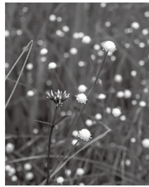
シラタマホシクサ

時 ●9月11日(土)、12日(日)午前9時～正午 ●9月16日(木)午後2時～5時(いずれも雨天中止) 場 吉賀池湿地(旭ヶ丘運動広場内に臨時駐車場あり) 内 シラタマホシクサや午後のみ花を咲かせるミズオトギリなど、秋の湿地植物の公開 費 無料 他 ●申し込み不要。動きやすい服装・靴で会場へ直接お越しください●公開日の会場案内・受け付けなどのボランティアを随時募集しています。興味のあるかたはお問い合わせください