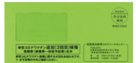
接種券封筒(イメージ)

対象は、2回目接種から原則8カ月以上経過した18歳以上のかたです。対象となるかたに緑色の封筒で接種券を順次発送します。今後のスケジュールなどの詳細は、広報おわりあさひ、ホームページ、接種券に同封する接種案内などでお知らせします。