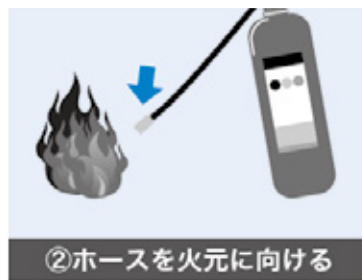
②ホースを火元に向ける