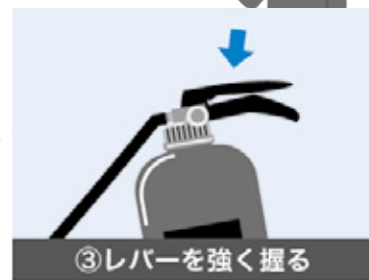
③レバーを強く握る