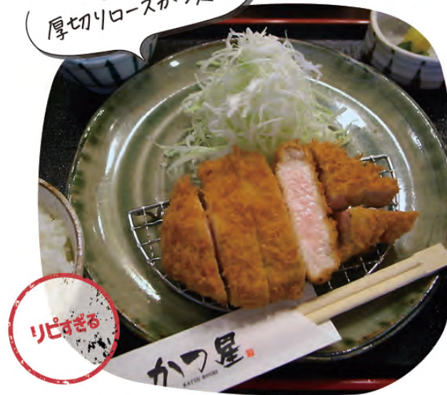
山形豚 厚切りリロスかつ定食