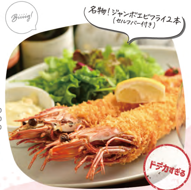
名物! ジャンボエビフライ2本 (セルフバー付き)