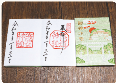
猿田彦神社の御朱印(中央)

市民の皆さんに尾張旭が大切な「泉」と思っただけのよう、最善を尽くして市政運営に取り組んでいきたいと思ひます。