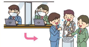
別表1 営業時間短縮等を要請する施設