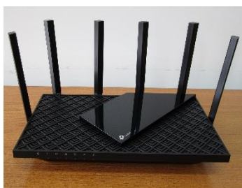
貸出し用 無線 LAN