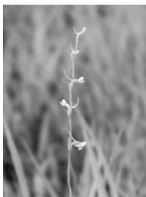
コバノトンボソウ

費 無料 他 ●申し込み不要。動きやすい服装・靴で会場へ直接お越しください ●公開日の会場案内・受け付けなどのボランティアを随時募集しています。興味のあるかたはお問い合わせください