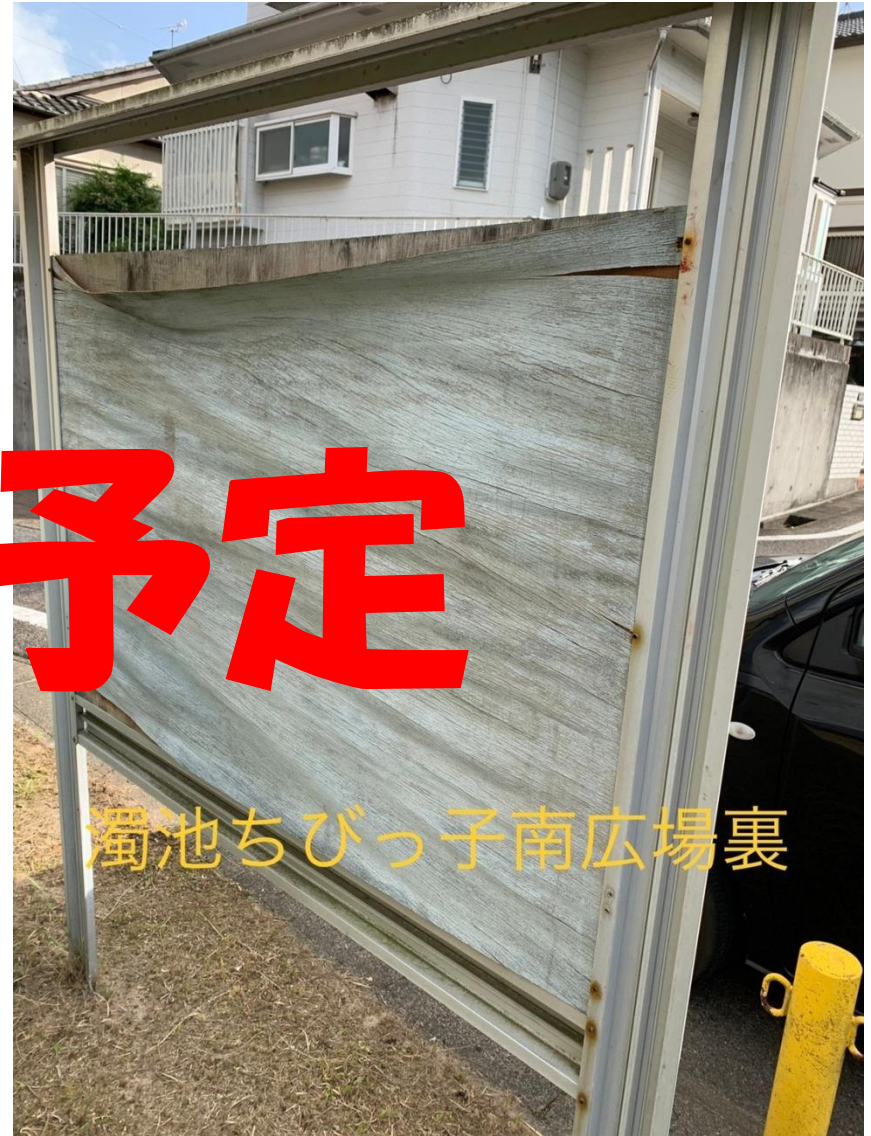
濁池ちびっ子南広場裏