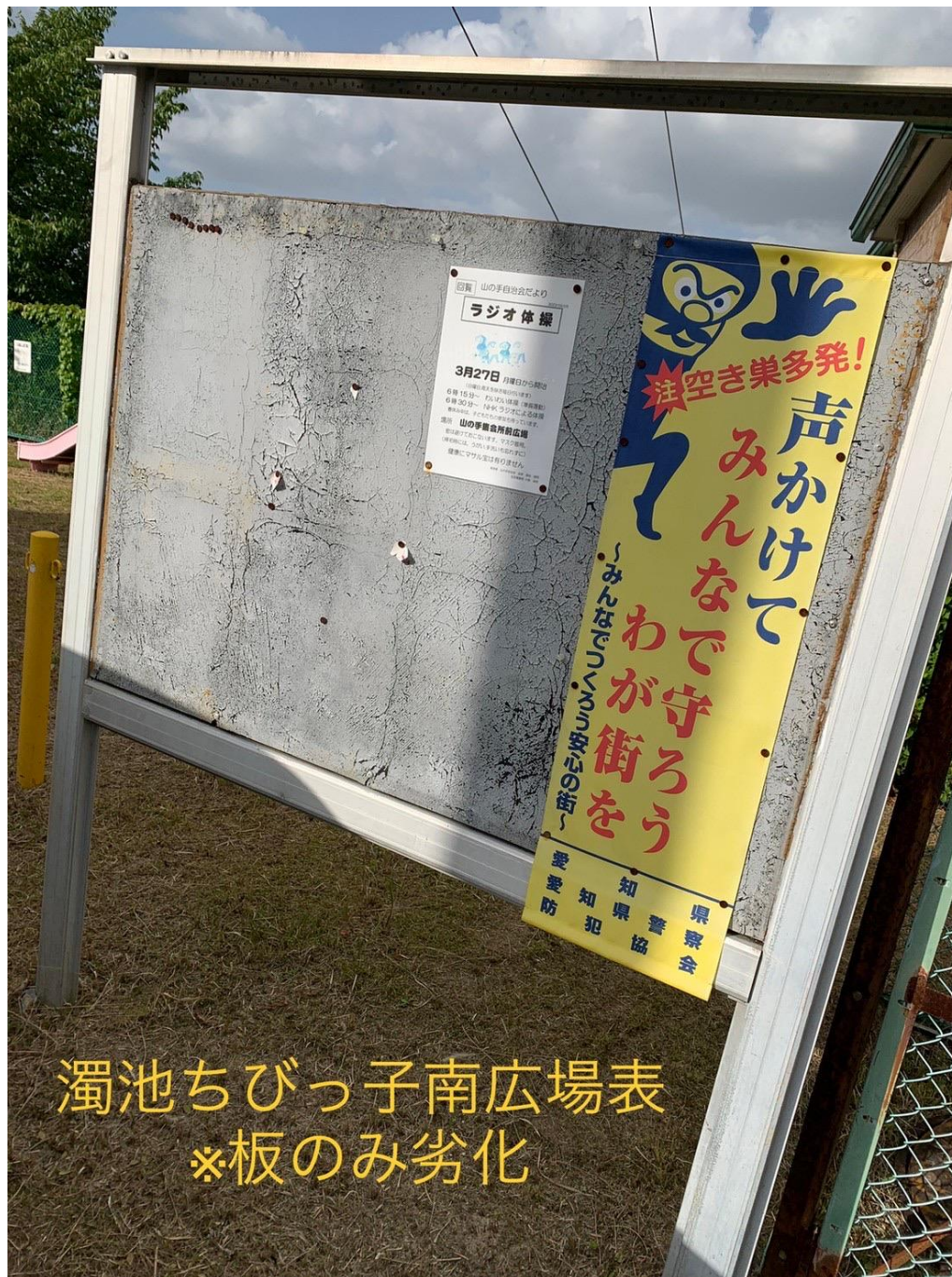
濁池ちびっ子南広場表 ※板のみ劣化