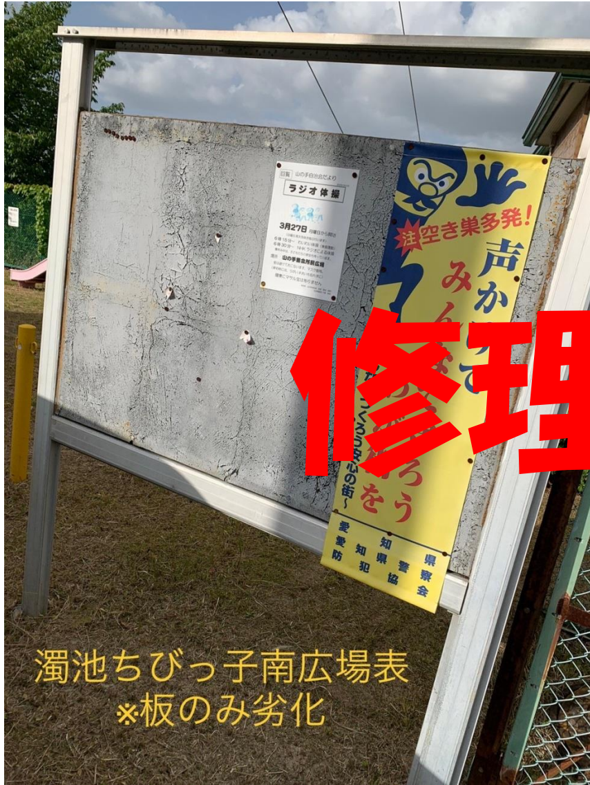
濁池ちびっ子南広場表 ※板のみ劣化