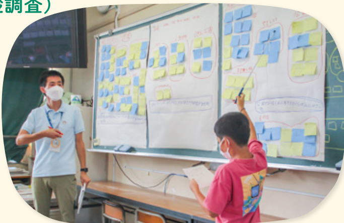
▲小学生の考えた「めざすまち」の発表