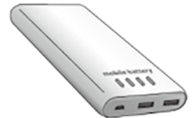
モバイルバッテリー