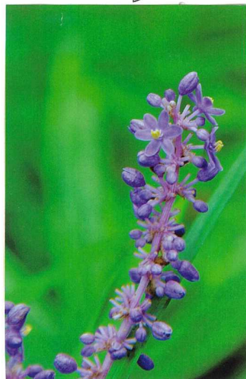
▶左側写真とスケッチは牧野富太郎氏 花はヤブラン 誕生日の花。9月20日。 <花とは忍科>