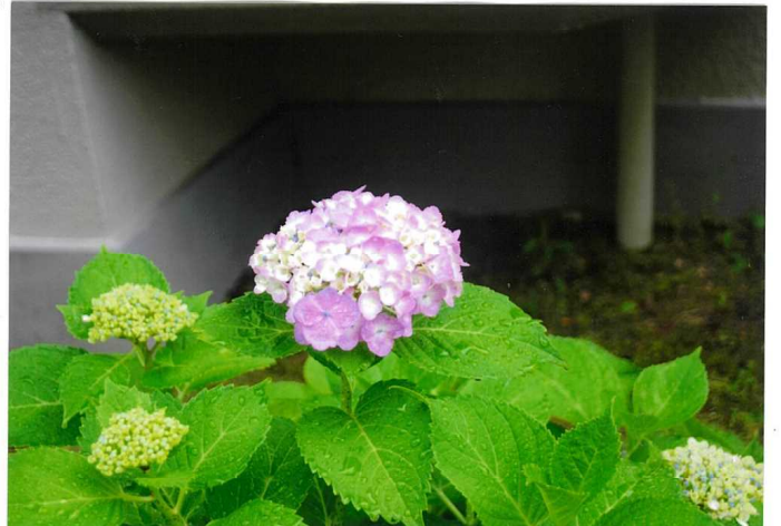
(私の住んでいるマンションは) アジサイマンションです。