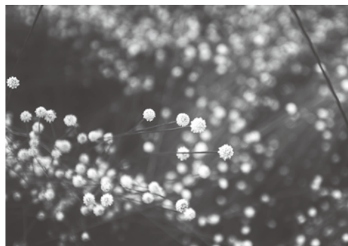
シラタマホシクサ

止) 場 吉賀池湿地(旭ヶ丘運動広場内に臨時駐車場あり) 内 シラタマホシクサや、午後のみ花を咲かせるミズオトギリなど、秋の湿地植物の公開 費 無料 他 ●申し込み不要。動きやすい服装・靴で、会場へ直接お越しください●公開日の会場案内・受け付けなどのボランティアを随時募集しています。興味のあるかたはお問い合わせください