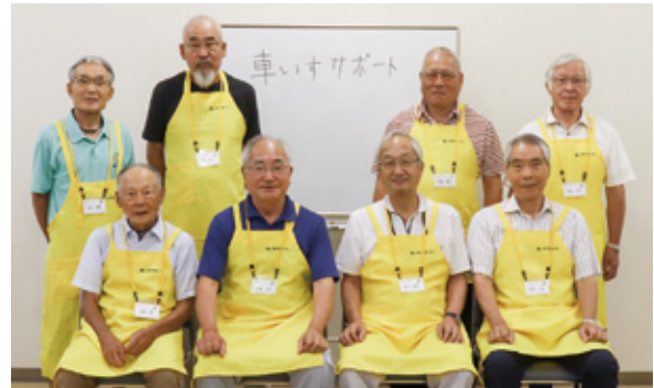
車いすサポートの皆さん