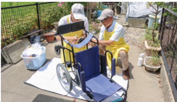
車いすの簡易点検・清掃活動の様子

です。また、車いすを利用されているかたの気持ちを考え、しっかりと学ぶ姿勢のある子どもたちがいるとうれしく思います。