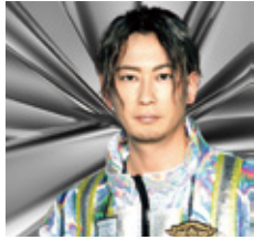
特別ゲスト 「DA PUMP」TOMOさん