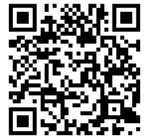
メールアドレス 二次元コード