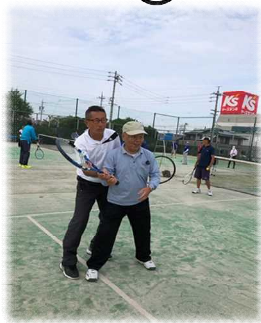
一人一人にアドバイスをする平井健一プロ