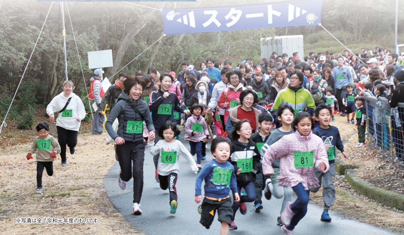
▼市民ジョギング大会