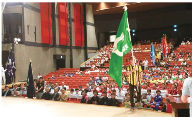
▲市民体育大会総合開会式