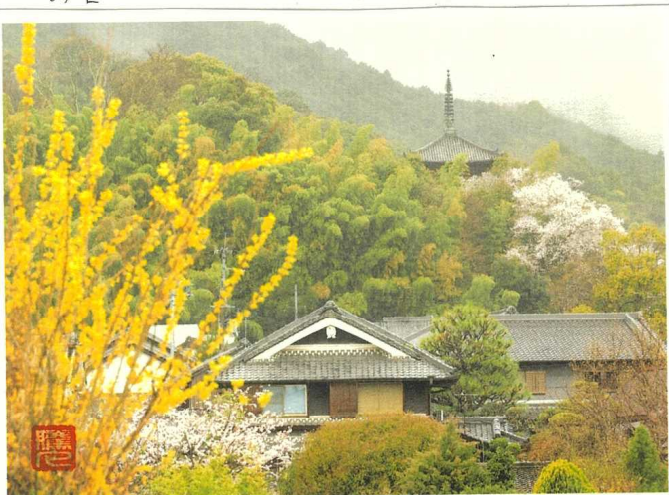
「奈良当麻寺遠望」阿波和紙

アラレちゃんか走るときのヤドレ とく独特の擬音は、多世連の 流行になった。世界のどれか けの数の人が心を軽んじて、 走り回ることか。