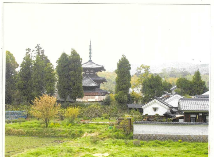
「斑鳩三塔 法輪寺」阿波和紙