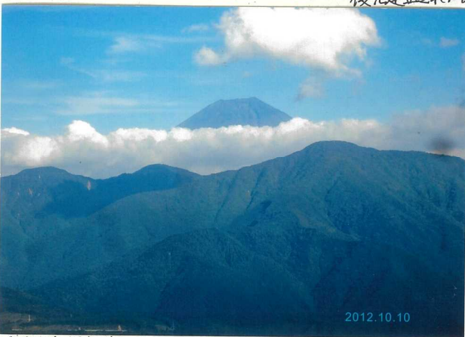
▲奥之院 思親閣の途中 ロアウェイからの富士山。