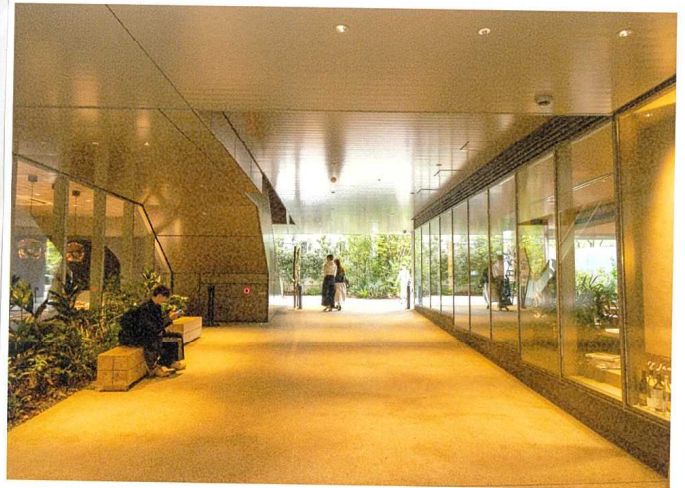
④ 9213. 2024. 4. 23. 式場弘乃ビル1F 施設内回廊

東京がおもしろい！ 都市は新陳代謝を繰り返す。常に変化し続ける。世界屈指のメカニクス、東京はおもしろい。 アウトプットが新しい動きが 起きている。 最新のトレンドが集まる話題 の麻布台ヒルズをはじめ、 下北沢などの変化を