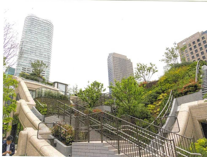
② 9163. 4. 22. 麻布台ヒルズ: 1F~2F