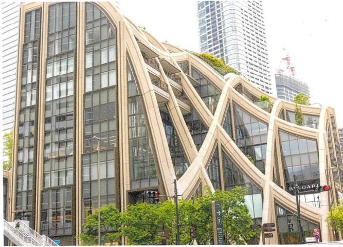
② 9086. 2024. 4. 22. 麻布台ヒルズ/建設中