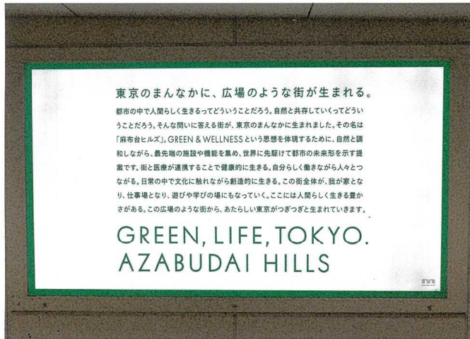
③ 9044. 2024. 4. 22. 麻布台ヒルズ: 地下運送通路