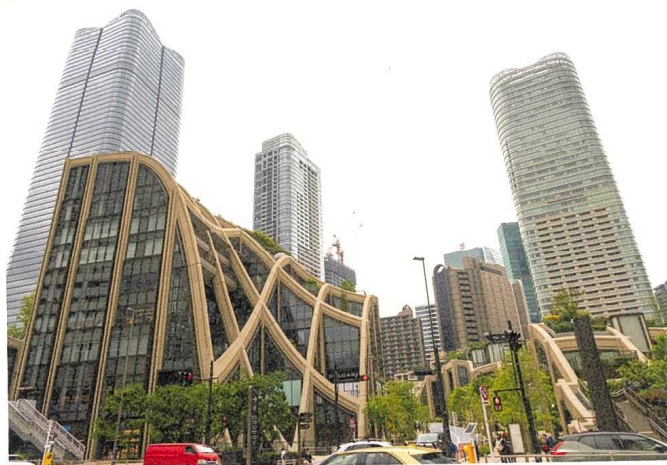
②9084. 2024.4.22 麻倉高層ビル-全体