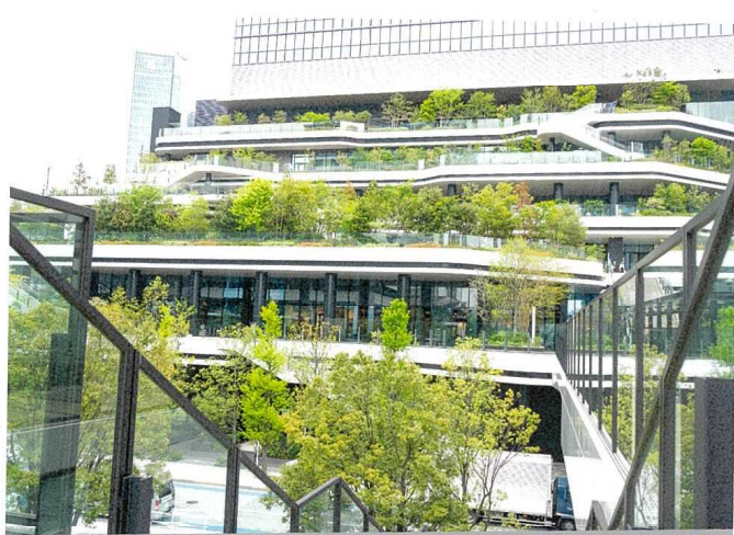
②955. 2024.4.23. 入替町タワー-全体