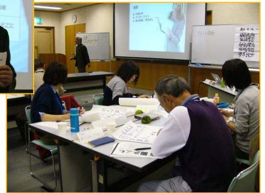
模造紙の書き方。マジックの角度、色使い、文字の大きさ、イラスト使用など実践練習中の様子。