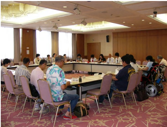
6月11日開催平成28年度第1回連絡協議会

市民活動支援センター連絡協議会は、設立から4年目を迎え、参加団体も49団体にまで増加しました。平成28年度第1回の会議を6月11日（土）に開催し、25団体28名が参加がありました。