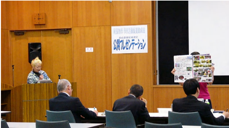
5月21日開催平成28年度公開プレゼンテーション

5月21日（土）、渋川福祉センターにて助成事業候補選定のための公開プレゼンテーションを実施し、下記のとおり助成事業を決定しました。はじめの一步部門に1団体、一般部門に9団体の申請があり、すべての事業が助成事業に決定しました。平成29年1月21日（土）に、事業の経過報告を行い、今後の活動を考える中間報告会兼交流会を予定しています。