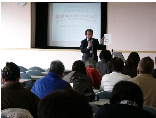
平成28年3月5日（土）開催 第4回交流会 「菊武学園のかたがたと交流しよう！」

市民活動支援センター連絡協議会は、設立から3年目となる平成27年度に、4回の交流会を開催しました。7月の参加団体相互の交流から始まり、10月には市内小中学校の先生との交流、12月には多世代交流館いきいきの見学を兼ねての交流会、3月には菊武学園のかたがたとの交流を行いました。小中学校や菊武学園との交流会での活動内容のプレゼンテーションでは、参加団体のみなさんが堂々と発表されていました。今後の連携の話も聞かれ、市民活動の発展に期待が持てるものとなりました。平成28年度も市民活動が盛り上がっていくよう、交流会の内容を企画していきます。