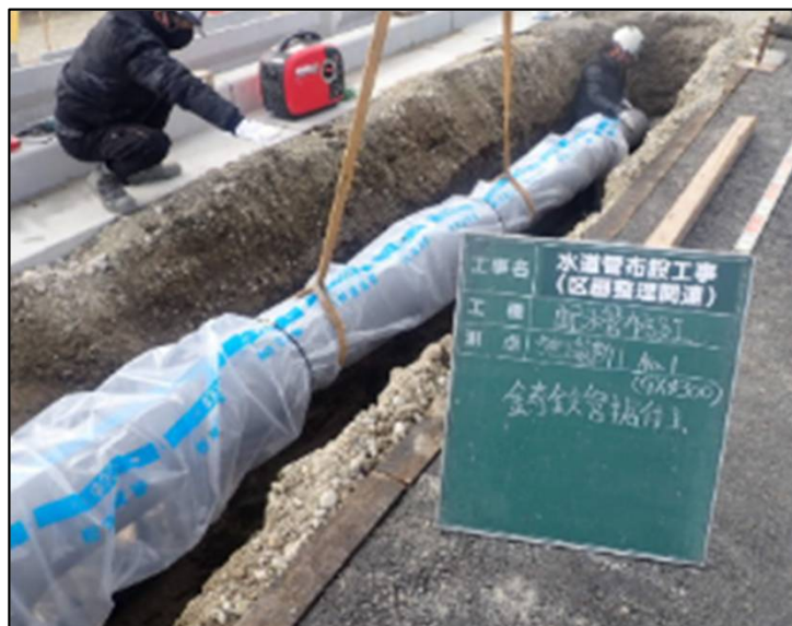
同種の工事状況写真