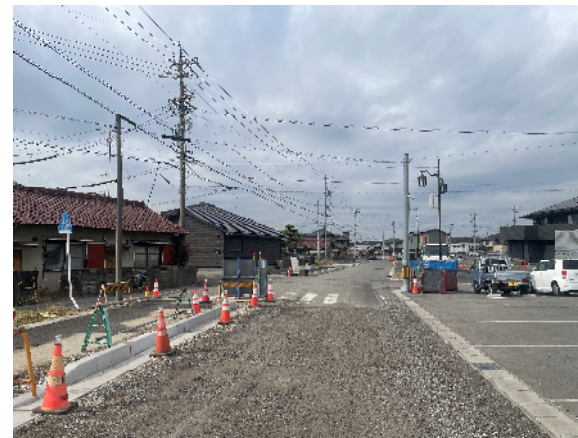
整備中の都市計画道路 北原山5号線