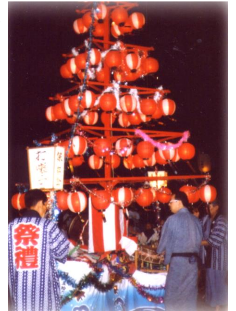
▲盆踊りでの提灯山