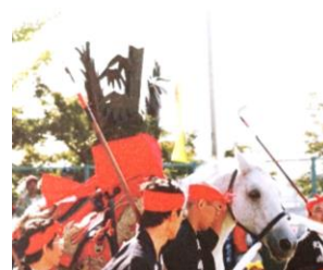
印場北部：淡竹のタケノコとススダメ

馬の塔は、豊作のお礼や雨乞いなどのために「標具」という飾りで飾られた馬を1 日だけお寺や神社に奉納する行事です。江戸時代の中ごろになると、とても豊作だった年に、いくつかの 村が集まって、大きなお寺や神社に馬の塔を奉納する「合宿」も始まりました。合宿は10年に一度く らいしか行われない特別な行事でした。馬を飾る「標具」は、普段の村のお祭りでは、「御幣」が使われ ますが、合宿では、それぞれの村ごとで異なる特別なものが使われます。現在、市内では印場北部、印場 南部、新居、稲葉、三郷地区の保存会が馬の塔の行事と道具の保存、伝承を行っています。