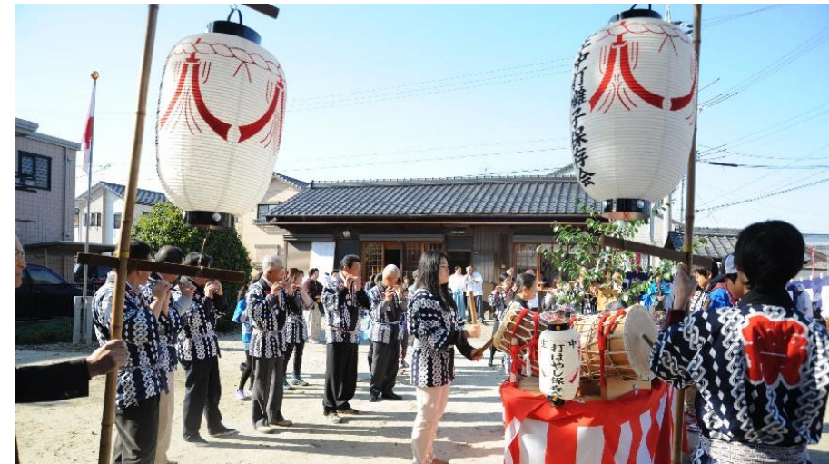
▲お祭りでの奉納(直会神社)

打ちはやしは、横笛や太鼓で演奏するお囃子のことで、かつてはこの地域でもお 神楽とともに受け継がれてきました。地域のお祭りでは、演奏しながら神社まで行進し、お神楽を奉納 します。また、盆踊りなどにも登場し、提灯山とともに盛りあげ ます。市内では印場北島地区、庄中地区、井田地区の3つの保存会 により伝統が守られています。