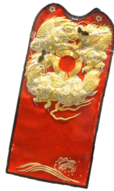
▲胸に当てる 「カザキリ」

棒の手は、棒や木太刀を使う民俗芸能で、2人から5人が型に 従って演技します。五穀豊穰を願って神社やお寺に奉納されます。尾張地方、西 三河地方で多く行われてきました。尾張旭市内には5つの流派があり、流派によ って違いがありますが、一般的に本来の神事に近い「表」といわれる型と、キレ モノ(真剣)などを使ってお客様を楽しませる「花棒」といわれる型があります。