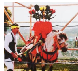
新居：ケシの花と実

種々のつまったケシの実を合宿で訪れる竜泉寺(名古屋)の本尊馬頭観音への水の奉納と雨が降ることを願う。