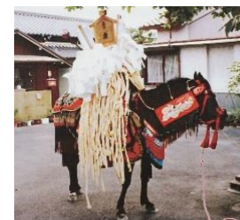
稲葉：高札、馬びしゃく、ケズリカケ